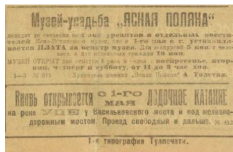
Рисунок 3. Коммунар. 1925. 30 апреля. № 96 (2028). С. 4.