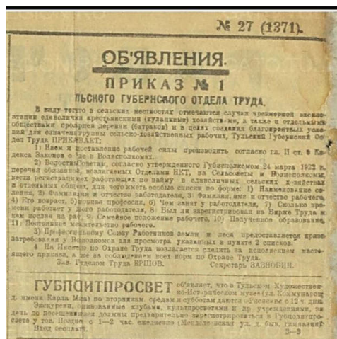
Рисунок 2. Коммунар. 1923. 6 февраля. № 27 (1371). С. 4.

С 1923 г. начался процесс реформирования макета объявлений о музеях Тульской губернии. На первом месте стали указывать наименования вышестоящего органа власти, в подчинении которого находились музейные учреждения [9, с. 4], что представлено на рисунке 2. В 1925 г. ситуация изменилась в пользу названий музеев. Чтобы заинтересовать читателей посещением музейных учреждений, перед коллективом тульского «Коммунара» была поставлена задача привлечь внимание жителей макетами красивых названий музеев. Их стали делать полужирным и большим шрифтом [10, с. 4], что представлено на рисунке 3. Такая практика сохранялась вплоть до 1929 г. Общей чертой являлось крайне мелкое написание последующей информации о музеях. На наш взгляд, такой размер шрифта представлял собой недостаток, поскольку населению требовалось нагружать зрение, чтобы прочитать сведения о музеях. Тем не менее второй вариант объявлений можно считать успешным, так как мгновенно привлекал внимание читателей.